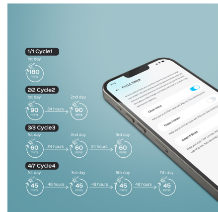
Beispiel Timereinstellung Achtung: Dauer variiert je nach Modell

Achtung: Die Wybotics Poolroboter sind nicht für den Betrieb in Schwimmteichen, Biopools bzw. auf Kautschuk-Folien geeignet.